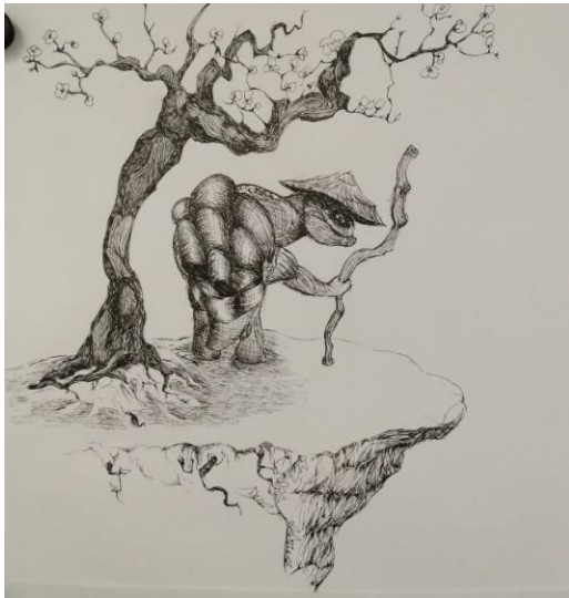
Série encre de chine