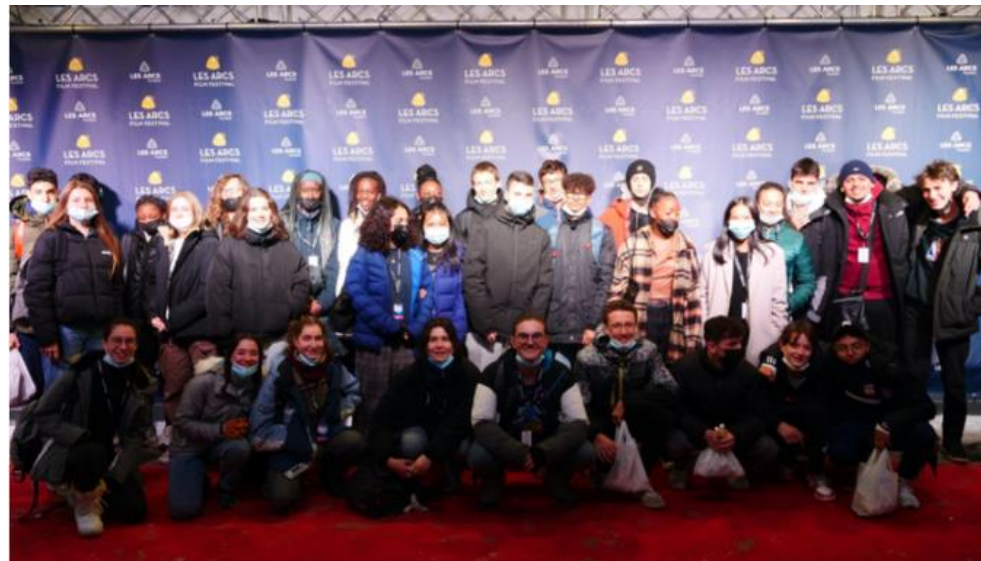
L'option cinéma au festival des arcs- 2022