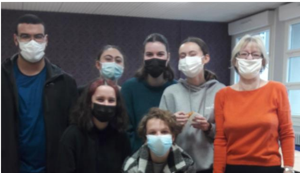
Remise du diplôme de certification en langue allemande

UN GROUPE EN PHYSIQUE CHIMIE UN GROUPE EN SES DE LA 2 NDE À LA TERMINALE