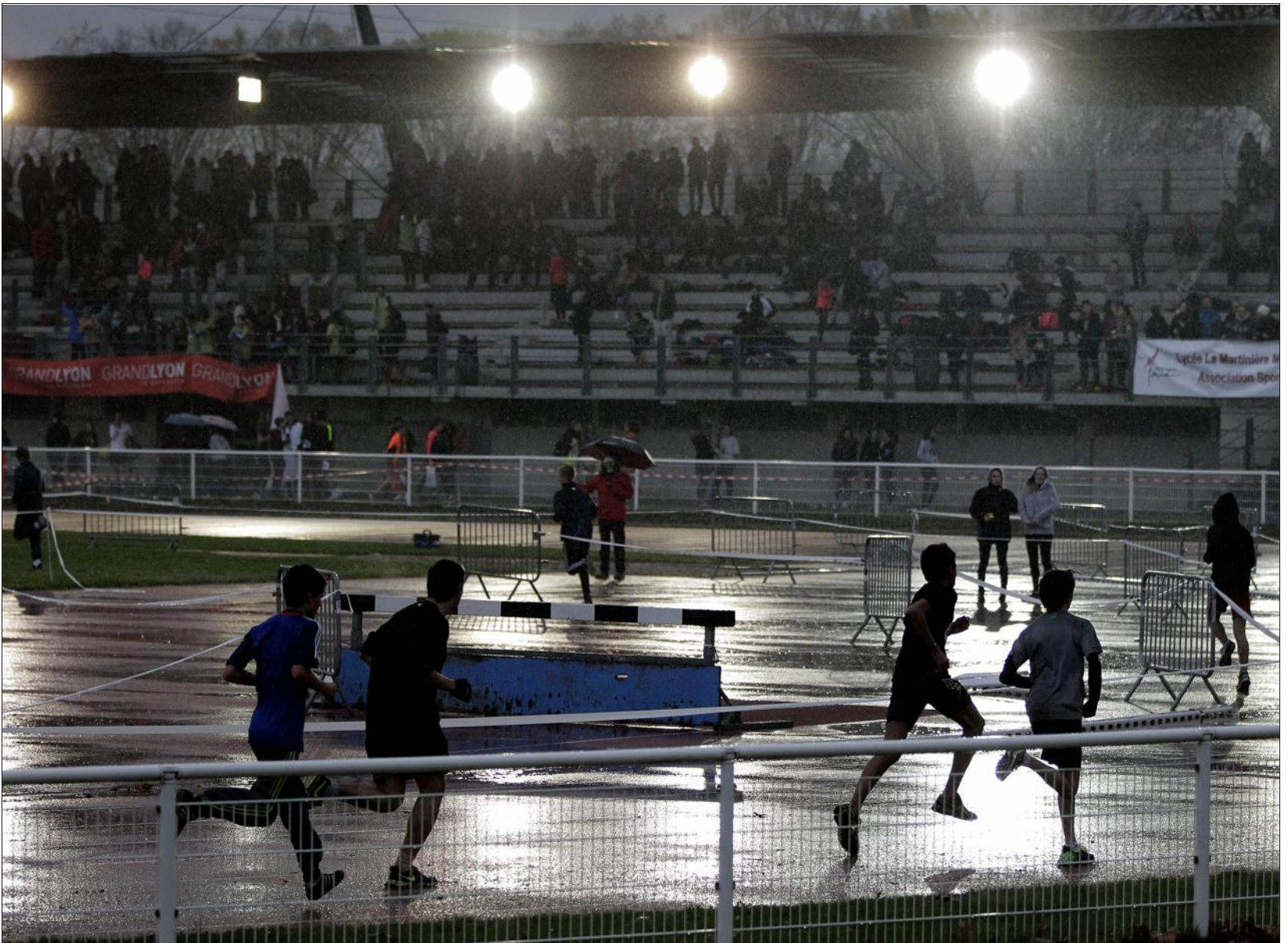
■ Assurément ce n'était plus l'été.