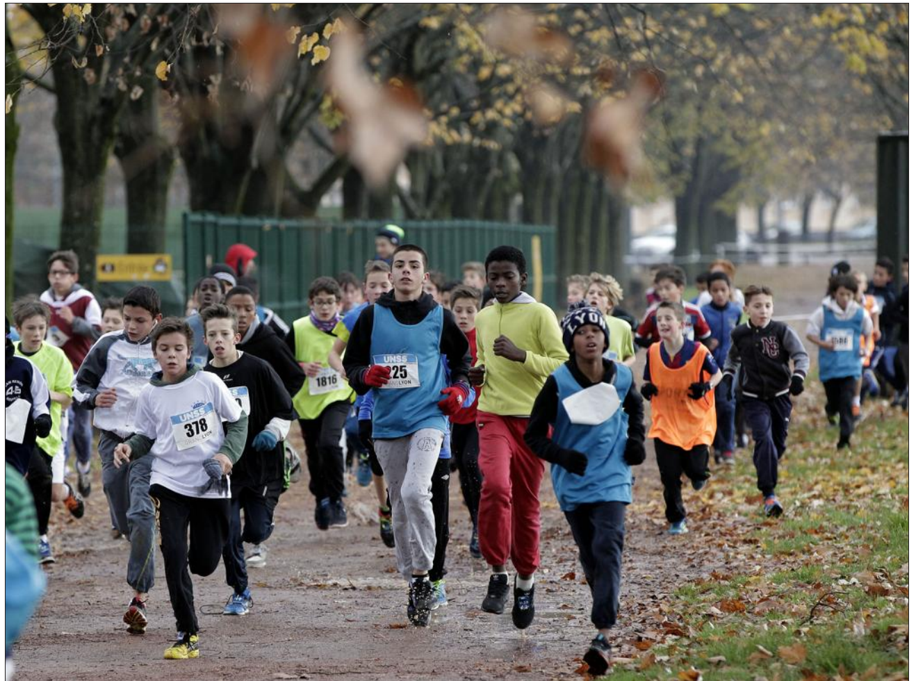
■ La course des benjamins

(Col Alain St Fons); 366. Lemberthe Ambrine (Col Dargent Lyon); 367. Mekdache Nawel (Col Valdo Vaulx En Velin); 368. Sarkodie Morgane (Col Valdo Vaulx En Velin); 369. ?Dossard #1067; 370. Jolivet-Boniface Talissa (Col St Viateur Amplepuis); 371. Gharbi Bilal (Col Gratte Ciel Villeurbanne); 372. Cabrosse Axel (Col Dargent Lyon); 373. Yazid Rehane (Col Eluard Vénissieux); 374. Durel Carla (Col Tourette Lyon); 375. Muth Noemie (Col Zay Brignais);