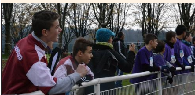
■ Ils étaient nombreux à pousser de la voix.