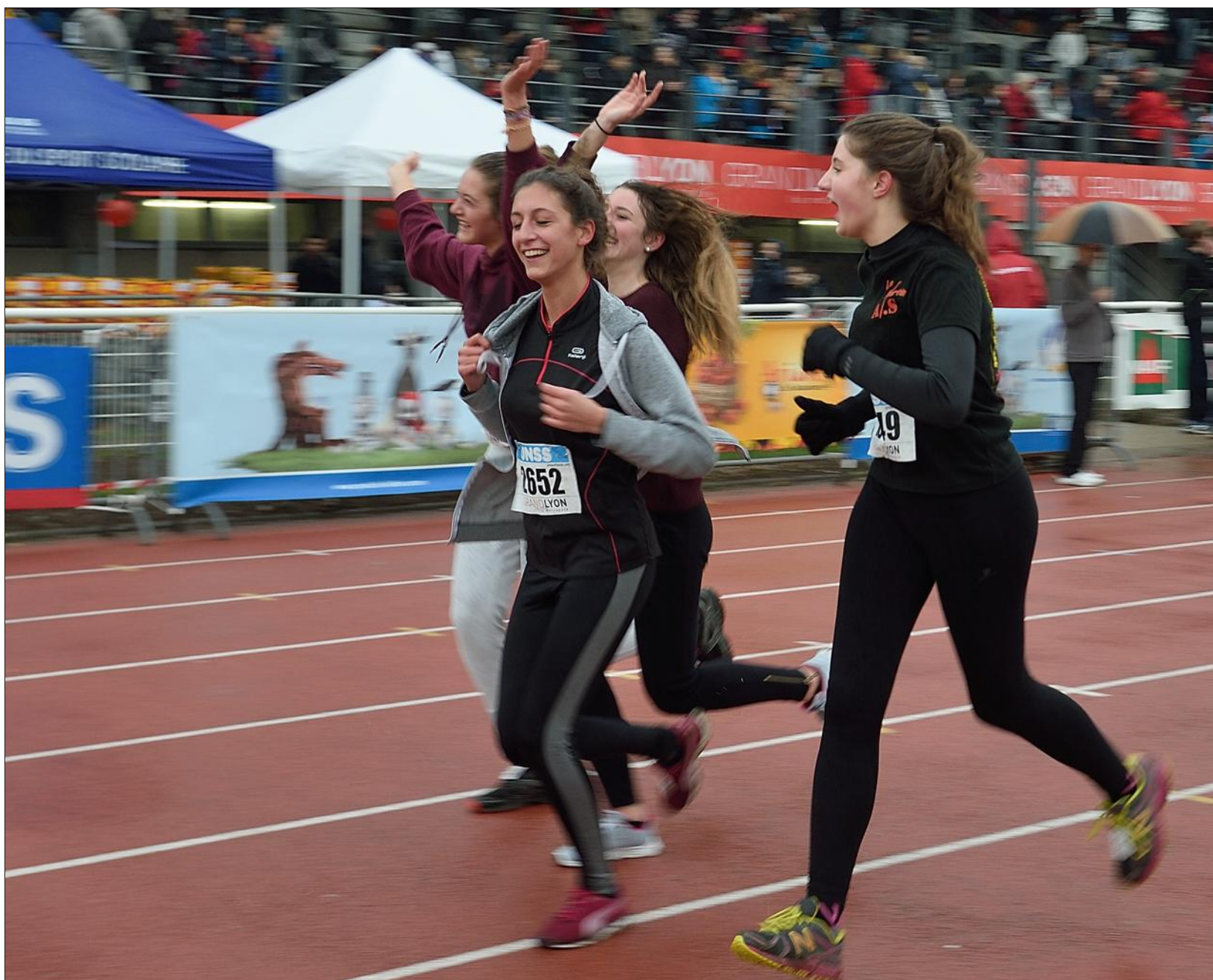
■ Malgré la pluie, les sourires étaient bien souvent au rendez-vous