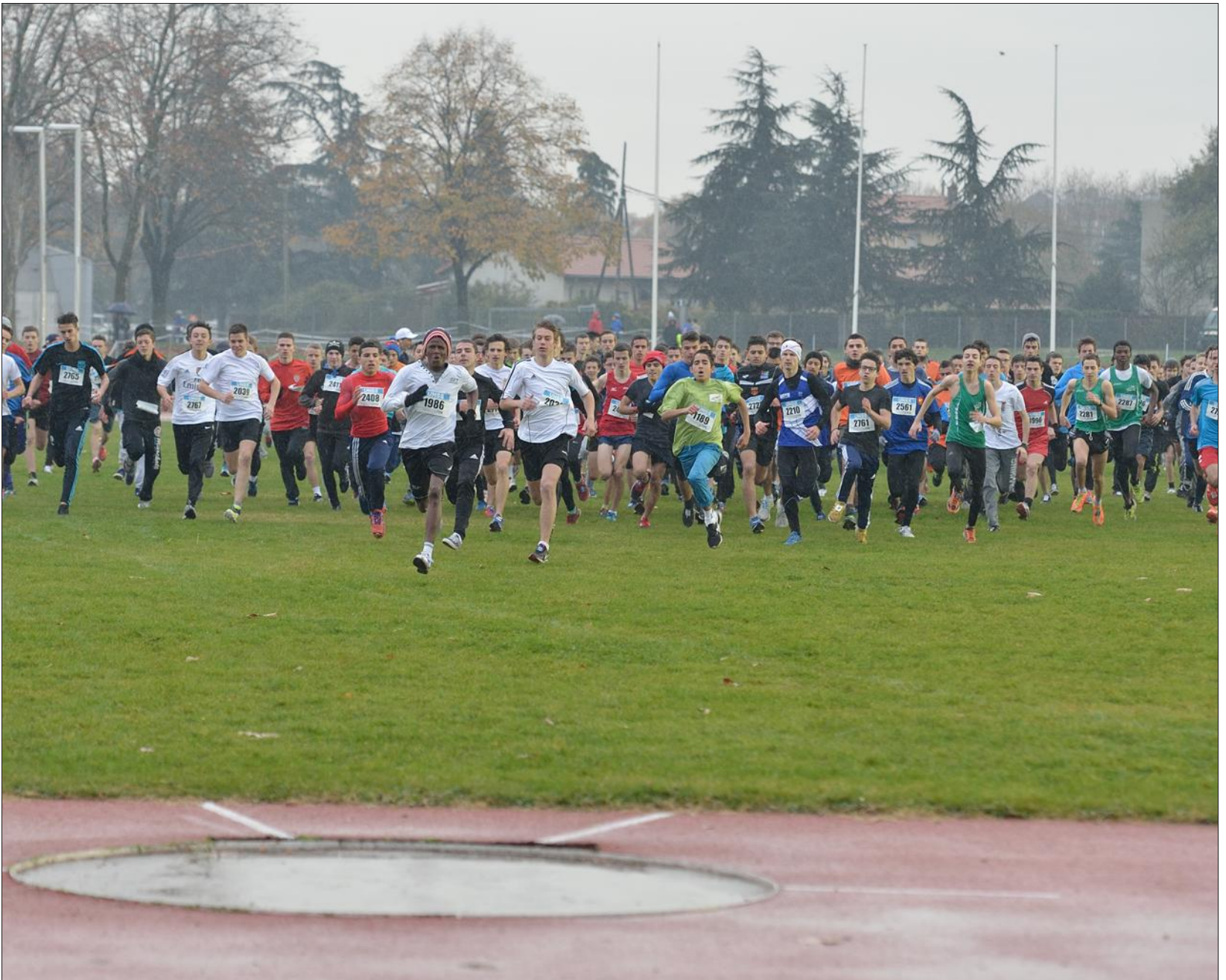
■ Certains diraient au vu de ce cliché qu'ils sont « marteau » de s'élancer si vite