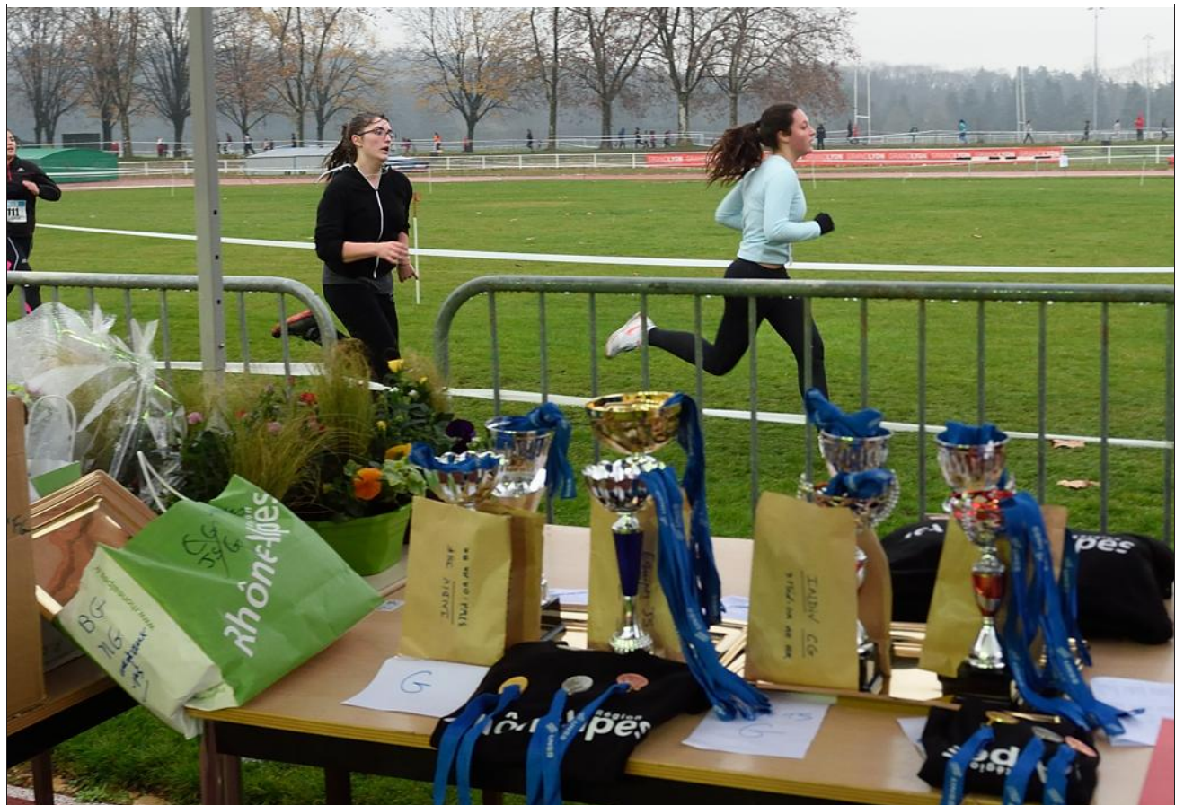
■ La foulée s'allonge devant la table aux trophées.