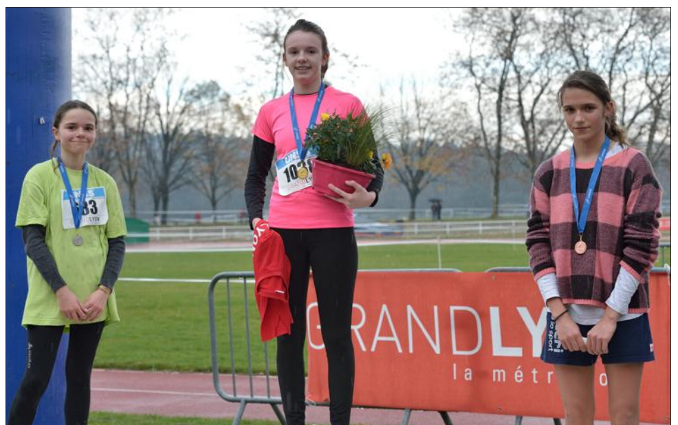
■ Le podium des benjamines