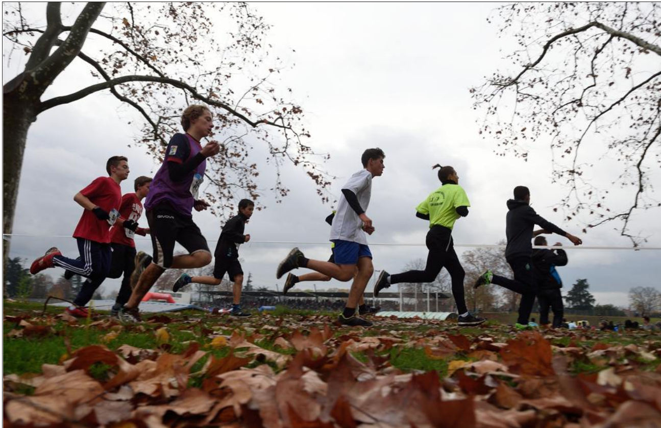
■ Les conditions climatiques étaient particulièrement rudes lors de cette épreuve (ici les minimes garçons).

Le stade du Rhône du parc de Parilly accueillait hier l'édition 2015 du cross de l'UNSS du Rhône. L'occasion pour trois milliers de collégiens et de lycéens du département de se mesurer les uns aux autres. Les visages marqués des coureurs finissant leurs courses tranchent avec les encouragements survoltés descendant de la tribune. Les jeunes essoufflés ou blessés, portés par les secouristes, avec ceux