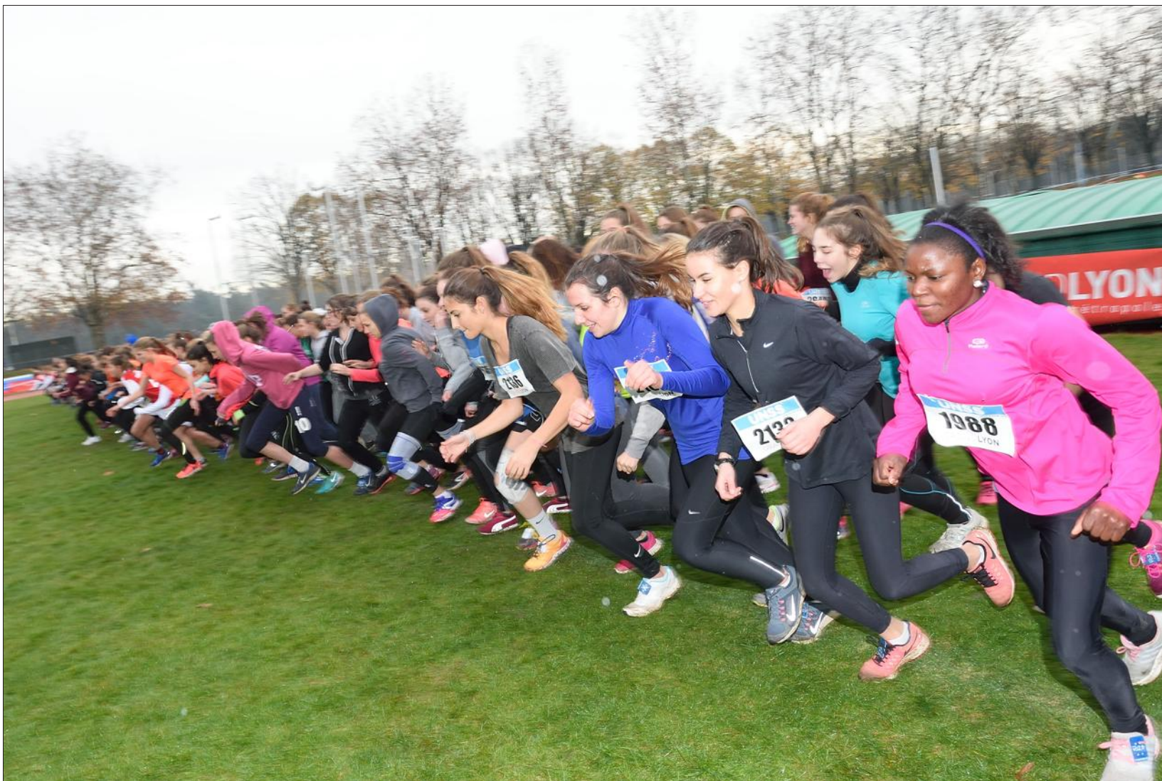
■ Les féminines enthousiastes au départ.