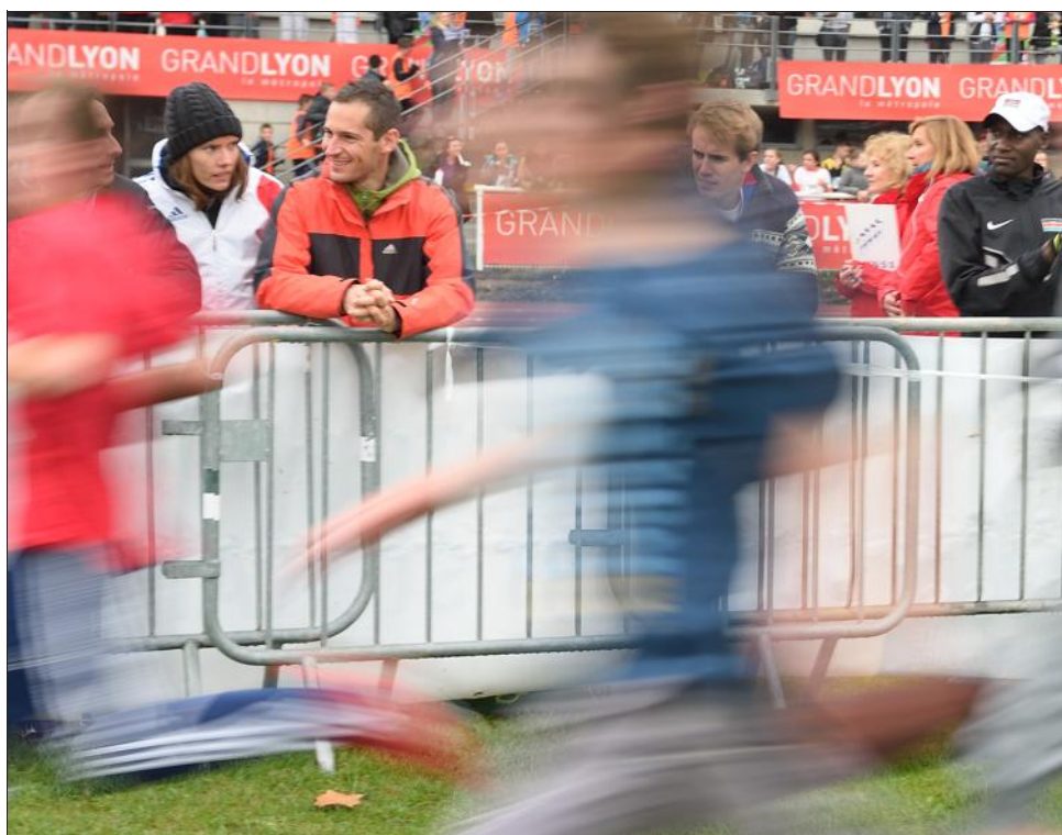
■ Les sportifs d'élite étaient aussi assidus spectateurs

1. Lyc International Lyon ; 2. Lyc Descartes St Genis Laval ; 3. Lyc Mart. Monplaisir Lyon ; 4. Lyc Herriot Lyon ; 5. Lyc Parks Neuville ; 6. Lyc Horticole Dardilly.