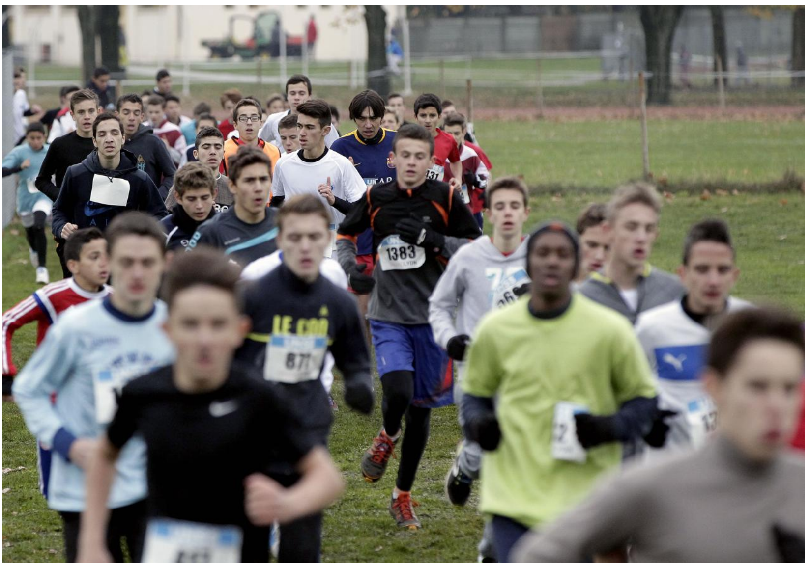
■ La course des minimes garçons.