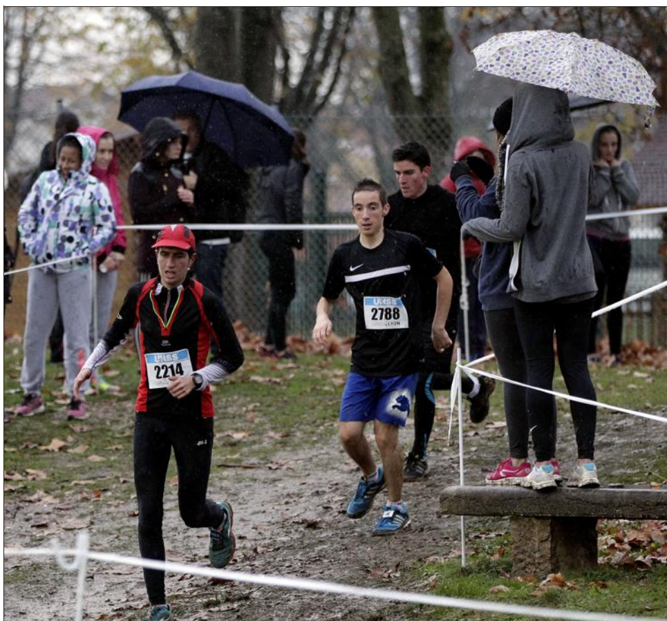
■ En descente, la pente était savonneuse