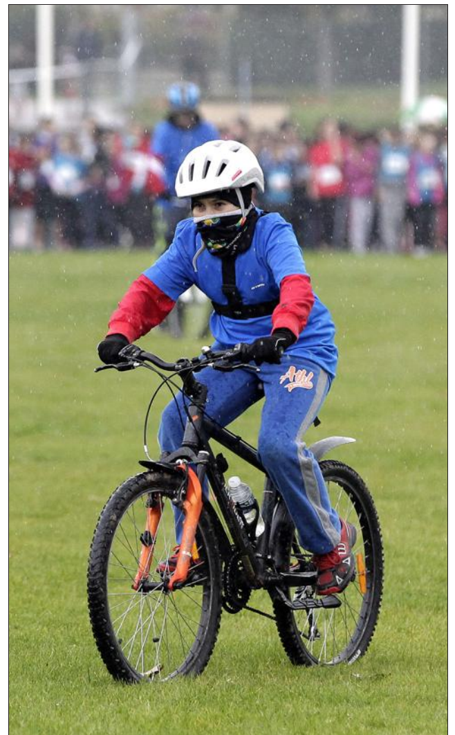
■ Les vététistes ont ouvert les courses