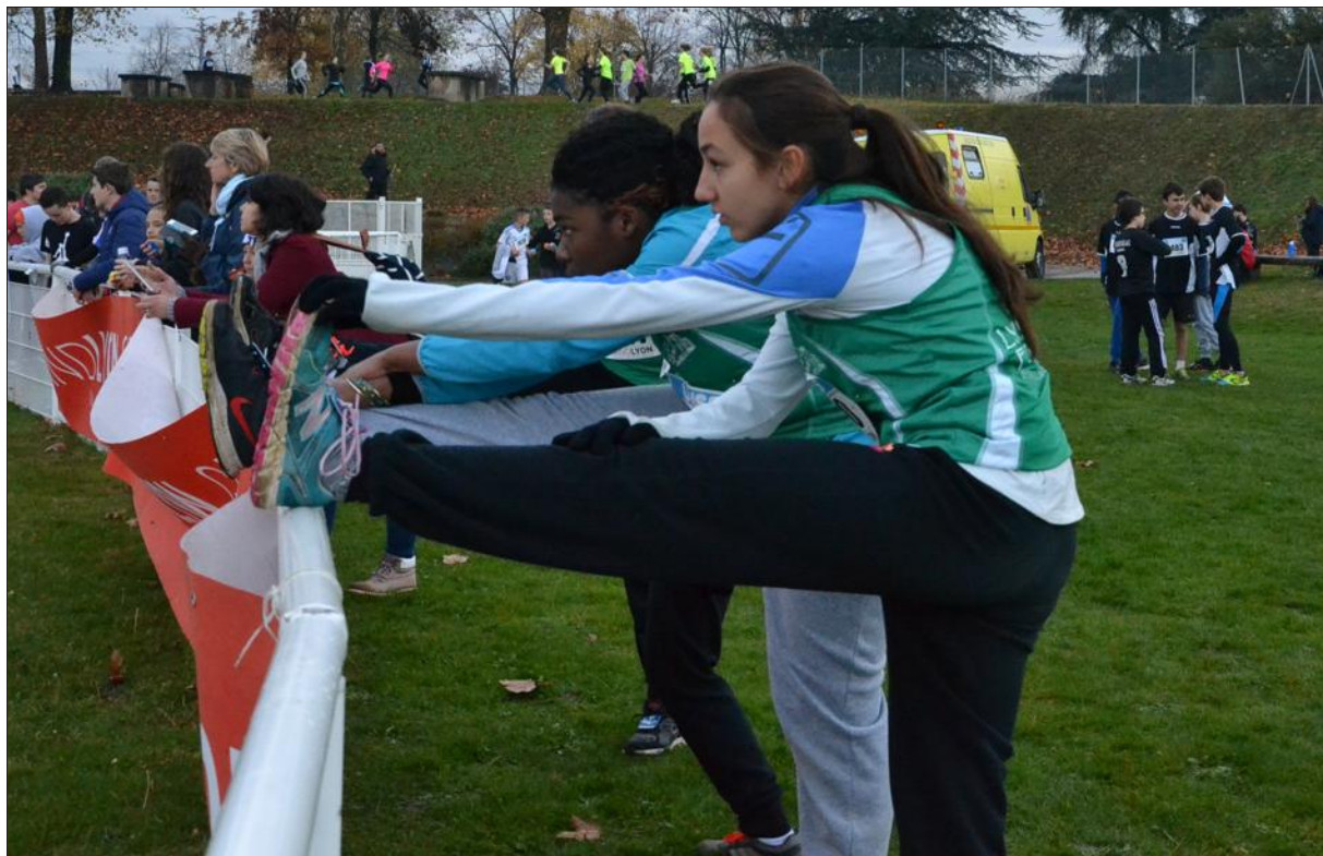
■ Ni le froid ni la pluie n'ont empêché les jeunes de courir !

Répartis en catégories d'âge, les participants s'échauffent en groupe pendant que les tribunes four-