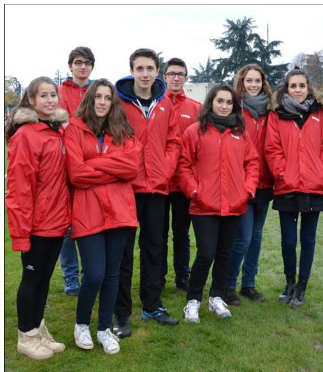
■ Les jeunes secouristes du lycée Ampère.